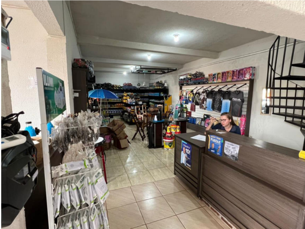
Estoques – Construmello

Perito/Administrador Judicial CRC-PR-066.334/O-0 CNPC-7360 Fone: +55 44 9 9950 9027