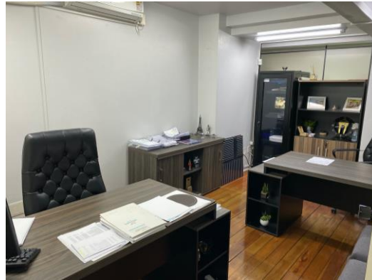
Compras e Financeiro