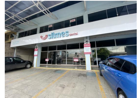
Área Externa da Loja