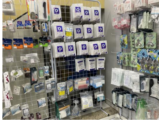
Produtos à Venda