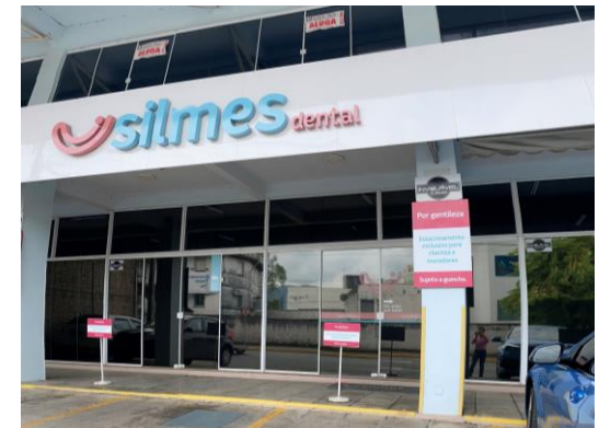
Entrada da Loja