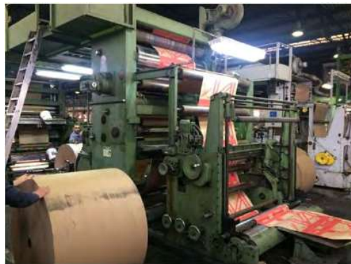
Maquinário de Impressão