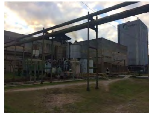
Vista Externa – Fábrica