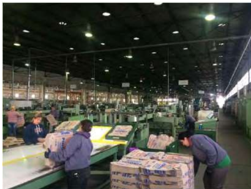
Finalização do Processo