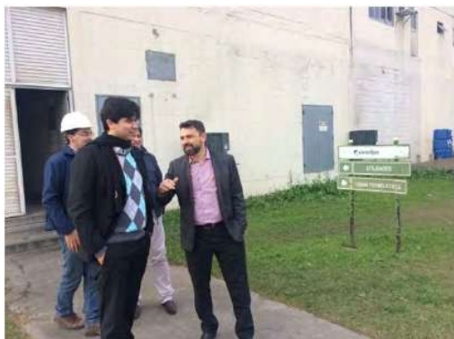
Termelétrica - Entrada