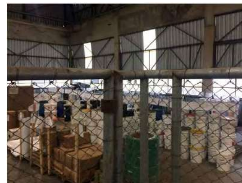
Projeto de Corrugados