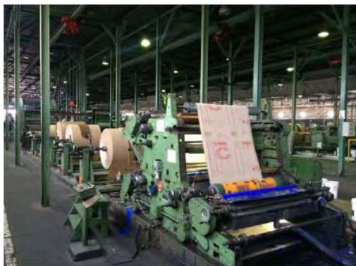
Maquinário de Impressão