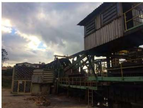
Vista Externa – Fábrica