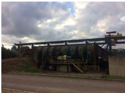
Vista Externa – Fábrica