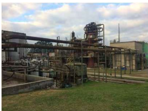
Vista Externa – Fábrica