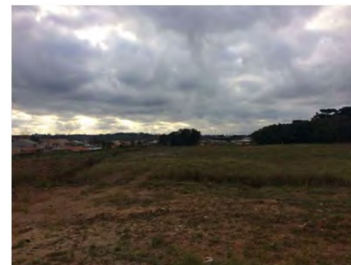
Terreno - Fundos da fábrica - Área de Preservação