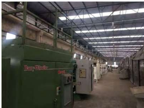
Projeto de Corrugados