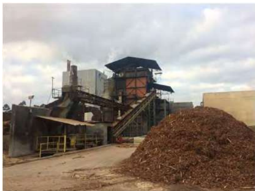
Vista Externa – Fábrica