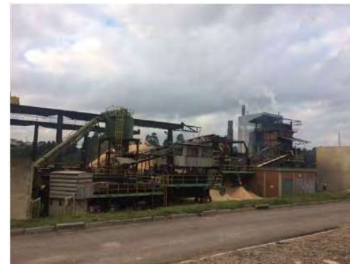
Vista Externa – Fábrica