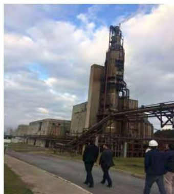
Vista Externa – Fábrica