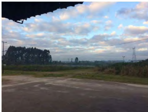
Fundos da Fábrica Cocelpa - Lago