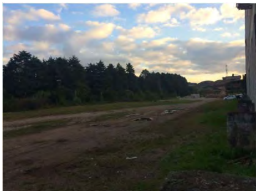
Fundos da Fábrica Cocelpa