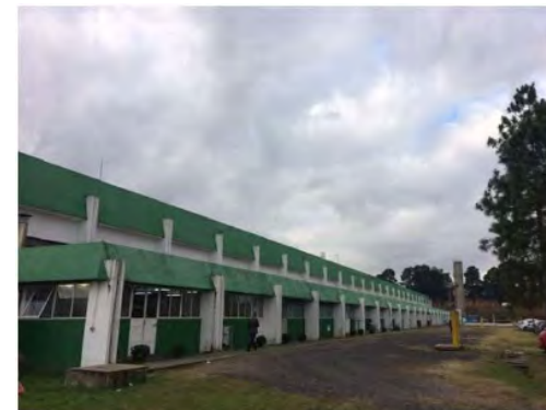
Vista - Frontal