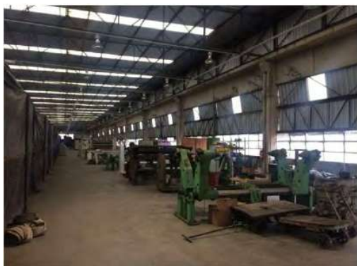
Projeto de Corrugados