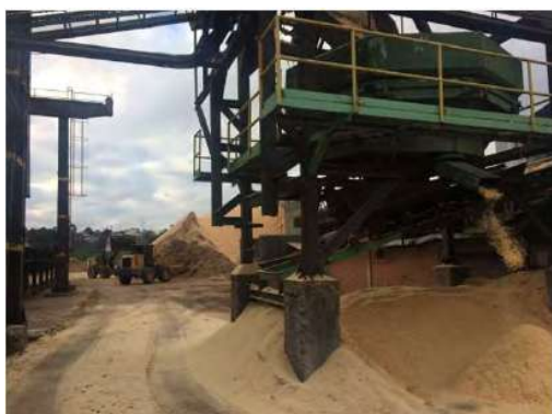
Vista Externa – Fábrica