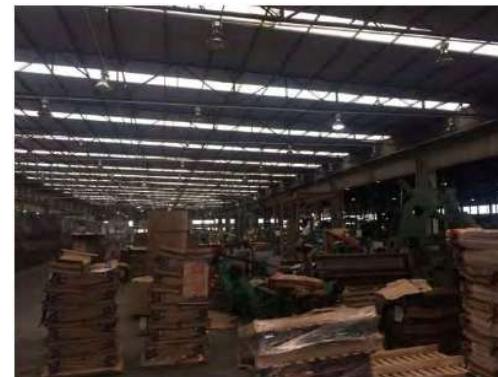
Finalização do Processo