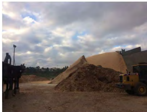
Vista Externa – Fábrica