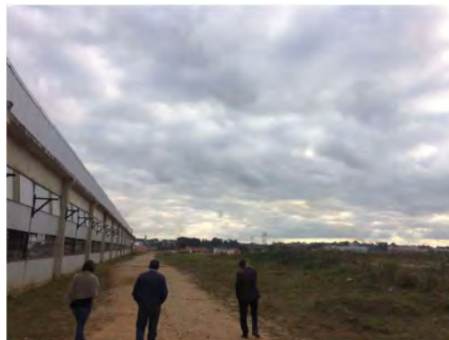
Vista - Fundos da Fábrica