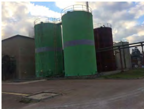
Vista Externa – Fábrica