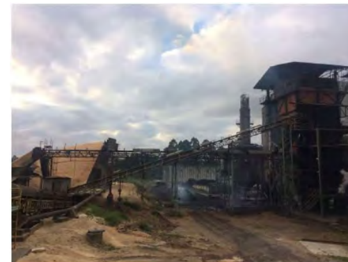
Vista Externa – Fábrica