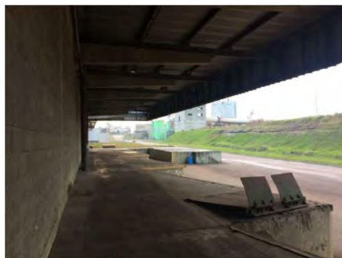
Docas - Expedição