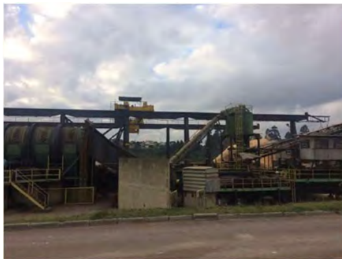
Vista Externa – Fábrica