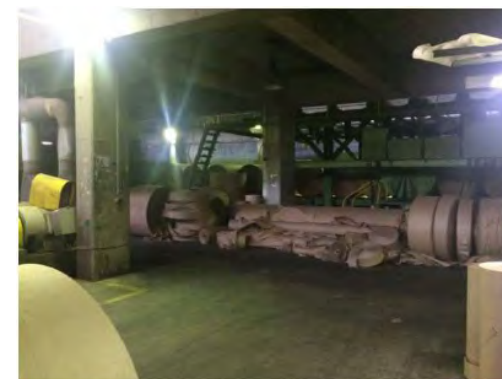
Finalização do Processo