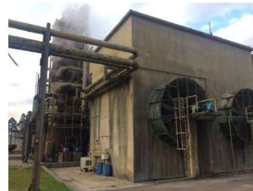
Vista Externa – Fábrica