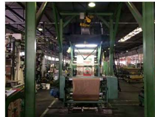
Maquinário de Impressão