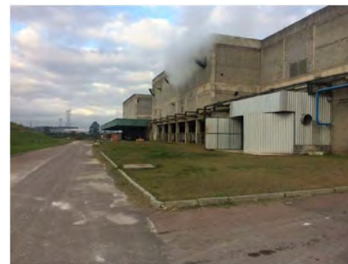
Vista Externa – Fábrica