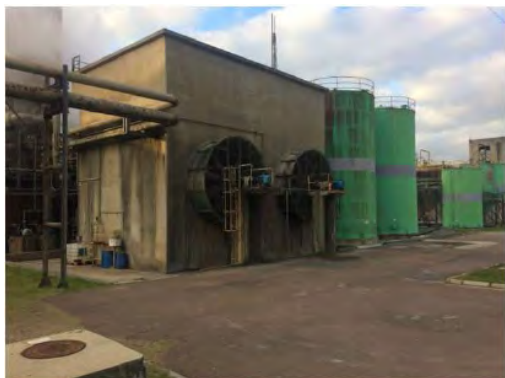
Vista Externa – Fábrica