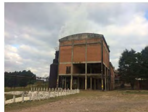
Vista Externa – Estrutura Desativada