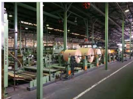
Maquinário de Impressão