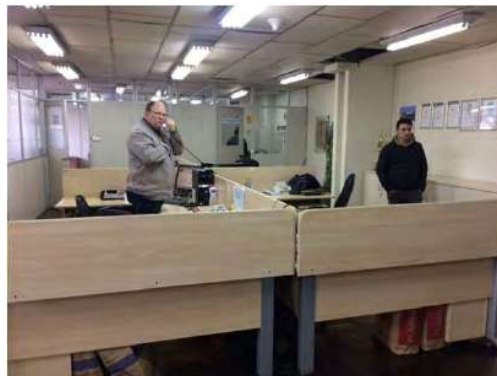
Escritório administrativo/corporativo Grupo Cocelpa - Arpeco