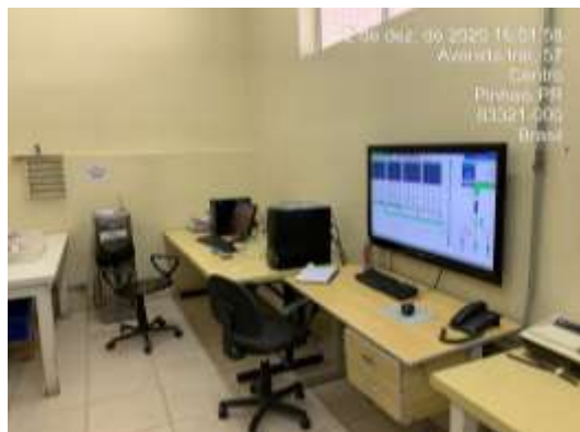
Moinho/Sala de Controle