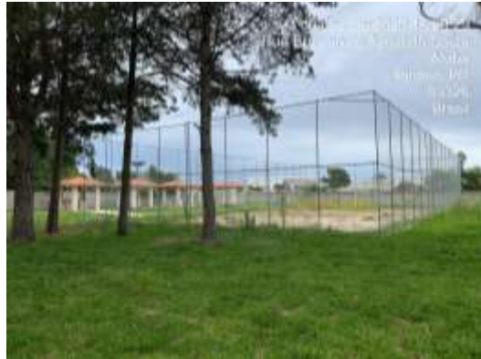
Área de Laser