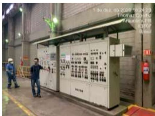
Fabrica/Quadro de Comandos