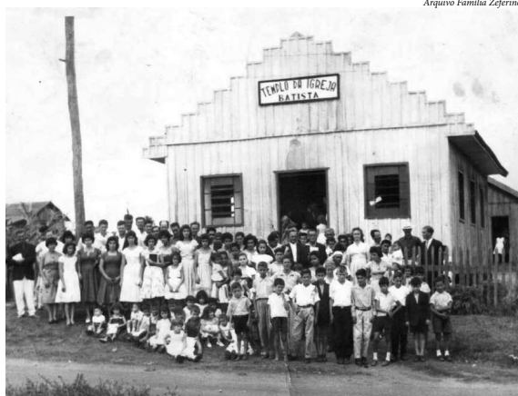
Inauguração do primeiro templo, de madeira, em dezembro de 1954