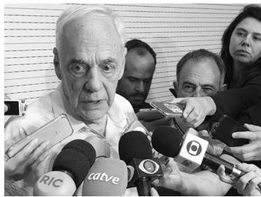
Para o Secretário da Administração e Previdência, Reinhold Stephanes, as mudanças devem contribuir para que o Paraná não entre no rol de estados que convivem com dificuldades para cumprir as obrigações mensais com a folha do serviço público.

CENÁRIO Segundo Stephanes, a reforma da previdência estabelece novas regras de funcionamento do regime próprio do Estado visando, de forma gradual, a sustentabilidade do sistema. Para o secretário, as mudanças devem contribuir para que o Paraná não entre no rol de estados que convivem com