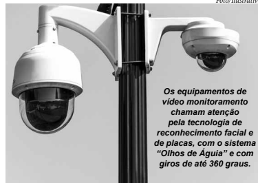
Os equipamentos de vídeo monitoramento chamam atenção pela tecnologia de reconhecimento facial e de placas, com o sistema "Olhos de Águia" e com giros de até 360 graus.