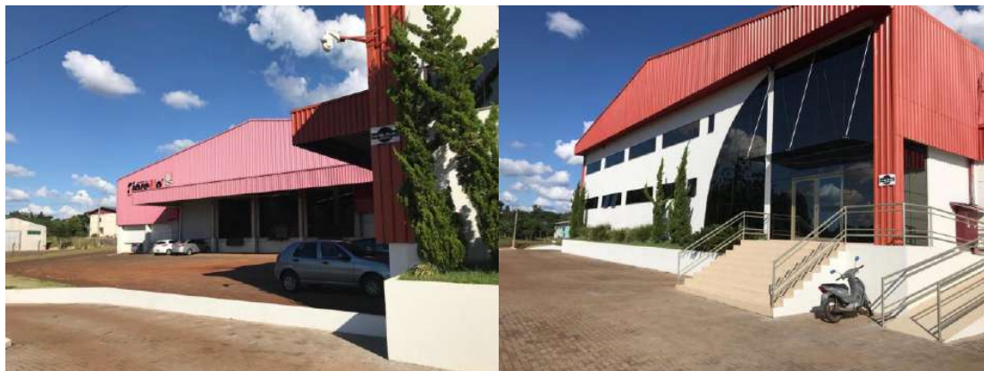
Figura 1: MÓVEIS FIORELLO MATRIZ.