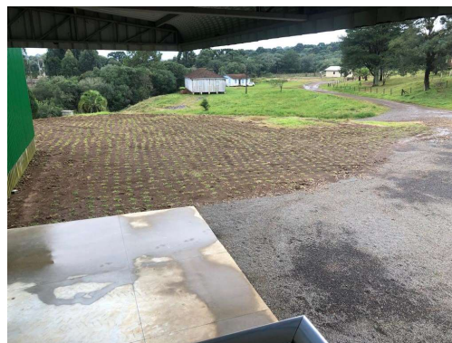
Entrada da Propriedade