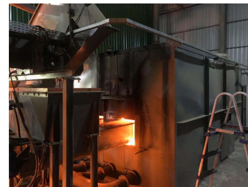
2ºForno de aquecimento