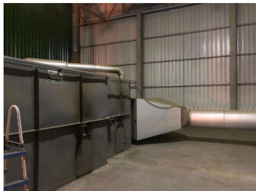
2ºForno de aquecimento