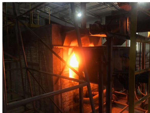
1ºForno de aquecimento